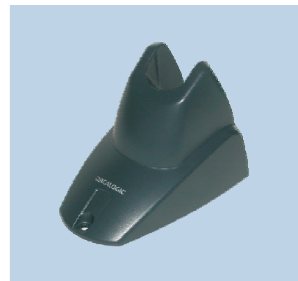
STD Heron™ serienmäßiger Ständer