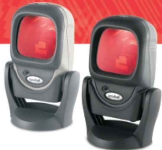
Kompatibel mit 2005 Sunrise Date

In zahlreichen Anwendungen bietet der multifunktionelle Präsentationsscanner LS 9208 eine dynamische Leistung, maximale Langlebigkeit sowie optimale Ergonomie und ermöglicht damit eine produktivere POS-Umgebung. Bei der Entscheidung für den LS 9208 können Sie auf den Markenhersteller Symbol vertrauen, einem Unternehmen mit weltweit bewährten Lösungen und Millionen von Scannerinstallationen.